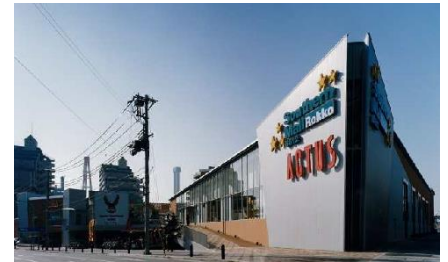
現在 小泉製麻(株)本社