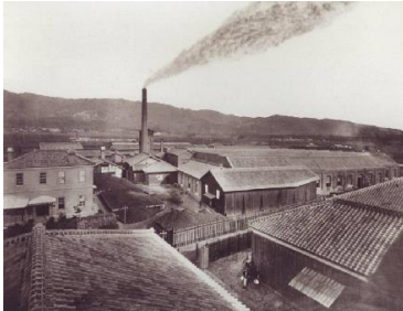
明治中期工場風景

当社は、創業128年を迎えました。明治政府の殖産振興策に従い、明治23年に、日本初のジュート紡績メーカーとして創業しました。創業当時の基本理念は、産業の発展と人々の生活を豊かなものにする事です。「環境」を軸にしながら、競争ではなく共創によるオンリーワンのモノづくりを目指しています。