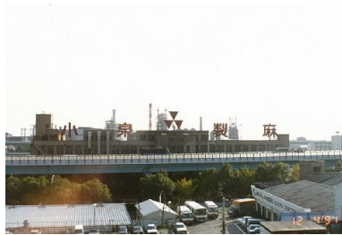
昭和50年頃工場風景