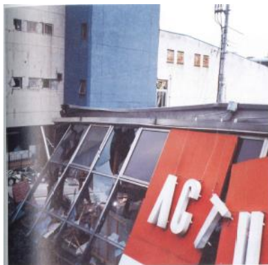
《1995年 阪神大震災倒壊》

アクタスは「豊かな暮らしとは、消費を繰り返すことでなく、作り手の顔が見える製品と、出来る限り長い時間を過ごすこと」と創業メンバーの言葉を胸にこれからも歩んでいきたい。