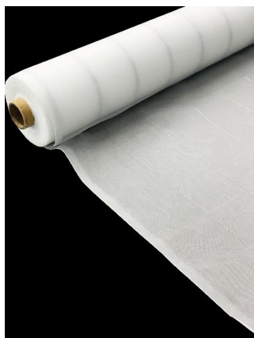
商品写真：《虫無視ネット》

また、この防虫ネットを低価格でご提供できるように、新たな取組みとしてネット限定販売とした。 (agmiru 限定)