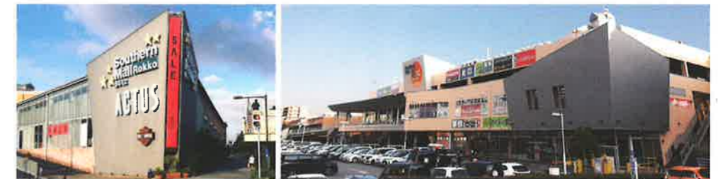
Southern Mall Rokko B612

私たちは、商業施設を運営・管理し、内装まで手掛ける工事業者です。これまで培ったノウハウとセンスを活かし、ビルや商業施設の修繕工事等を多数請負っています。オーナー×管理×施工というそれぞれの立場や考え方を理解しているサザンモール六甲だからこそ、安心と信頼につながる施工を可能にしています。