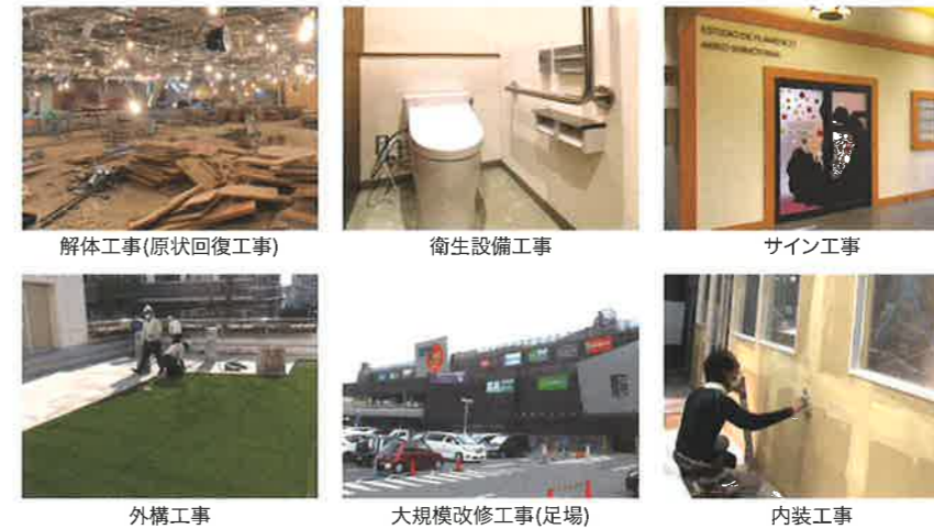
解体工事(原状回復工事)