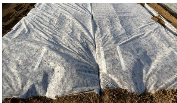
【Be Back シート】(千葉県での敷設)

加えて、原料に100%リサイクルのポリエステルを使用していますので、環境負荷低減にも貢献した資材となります。